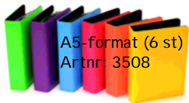
A5-format (6 st) Artnr: 3508