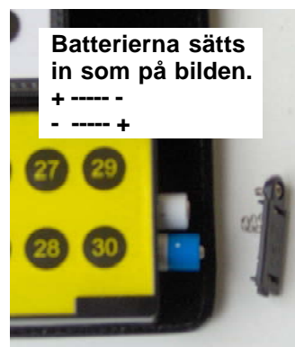
Batterierna sätts in som på bilden. + ---- - - ---- +