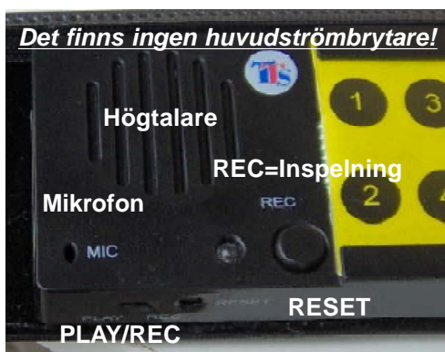
RESET - knappen Om det inte fungerar som det ska, tryck på knappen i Reset-hålet för att återställa (=återstarta).

Talande fotoalbum i format A5, A4 resp. A3 med 30 meddelanden på högst 10 sekunder för varje bild (totalt 5 minuter). De kan användas för intalat träningsmaterial, minnesstöd, meddelanden, AKK, steg-för-steg instruktioner, mm. Talapparaten är separat men en integrerad del av albumet.